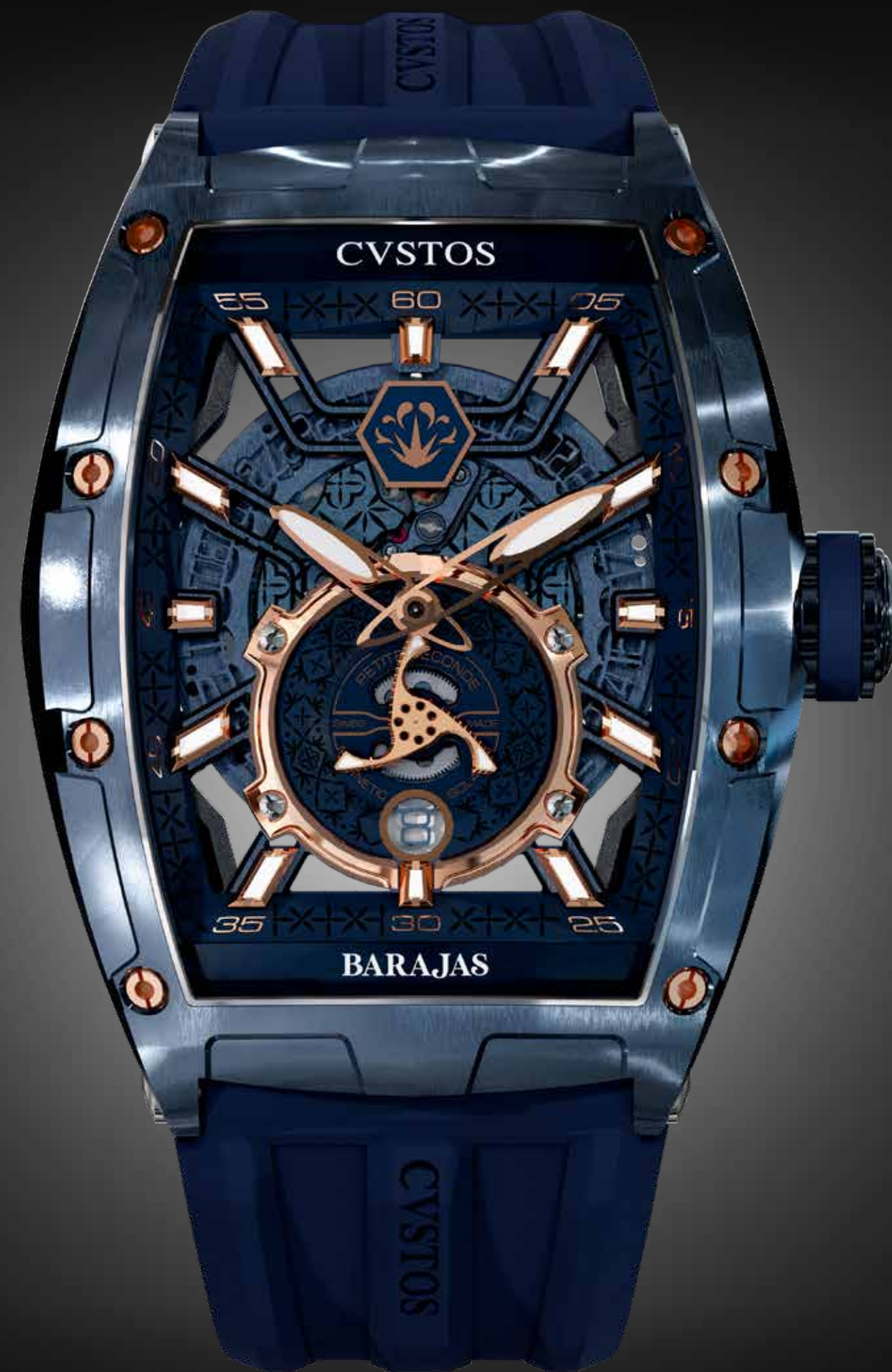
CHALLENGE JETLINER PS/BLUE STEEL 5N COMP/TEQUILA BARAJAS/LTD 30 PCS